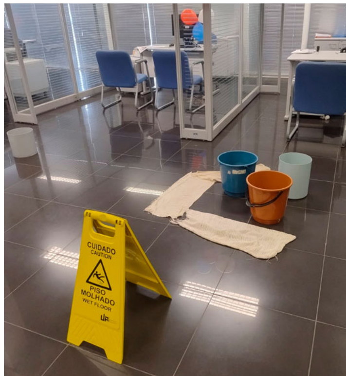
TRANSTORNO E RISCO DE ACIDENTE! Além dos funcionários, clientes também estão incomodados com a situação precária da agência