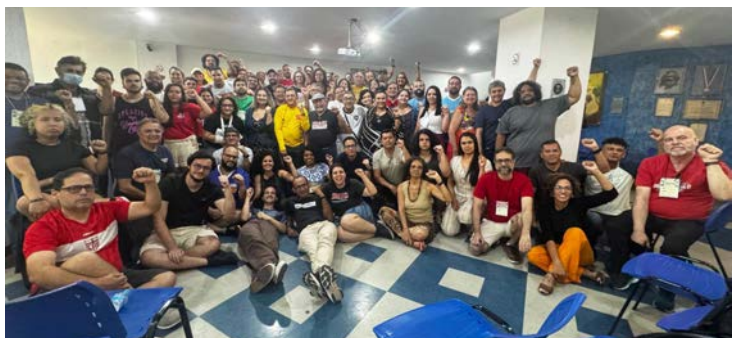
Mais de 70 bancários participaram do evento, realizado no Rio de Janeiro

Veja algumas das estratégias de luta definidas para 2025!