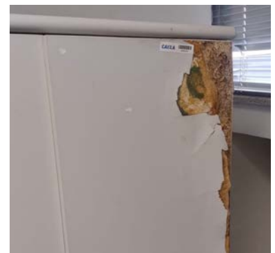
Acima, móvel danificado pela infiltração. Abaixo, teto destruído